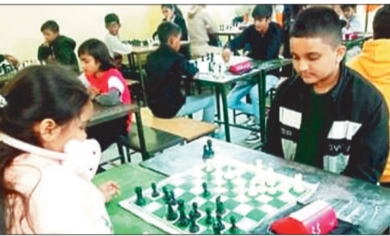
प्रतियोगिता के दौरान शतरंज खेलते प्रतियोगी।