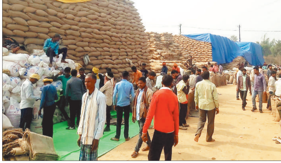
धान खरीदी केन्द्र में लगी किसानों की भीड़।

चुनाव में समर्थन मूल्य बढ़ाने की घोषणा और ऋण माफ होने की संभावना के कारण किसान नवंबर महीने की आखिरी तारीख तक धान खरीदी केन्द्र में नहीं पहुंच रहे थे। वहीं दिसंबर महीने में ही काफी संख्या में किसान धान खरीदी केन्द्रों में टोकन लेने के लिए पहुंचने लगे, लेकिन शासन द्वारा दैनिक खरीदी के लिए टोकन लिमिट निर्धारित होने के कारण समिति प्रबंधक भी टोकन लिमिट के हिसाब से ही खरीदी करने लगे। कृषि विभाग से मिली जानकारी के अनुसार धान खरीदी शुरू होने के पहले लगभग 20000 से अधिक किसानों का पंजीयन किया गया था। धान खरीदी को अब केवल तीन दिन ही बचे हैं और अब तक 18375 किसानों से धान खरीदी की गई है। यह आंकड़ा केवल कोरिया जिले का ही है। अब भी ढाई हजार से अधिक किसान टोकन के लिए समिति केन्द्रों के चक्कर काट रहे हैं। जिले में धान कटाई में हुई देरी