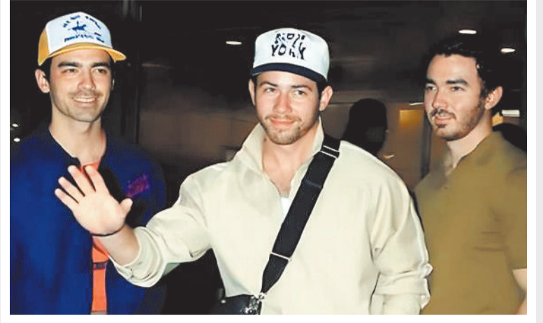
मुंबई। अमेरिकी पॉप रॉक बैंड जोनस ब्रदर्स शनिवार को मुंबई पहुंचे। वह एक कॉन्सर्ट के लिए इंडिया आए हैं। मुंबई के छत्रपति शिवाजी महाराज इंटरनेशनल एयरपोर्ट पर उतरे और पैराजो के लिए पोज दिए। वीडियो में निक को बेज रंग की शर्ट और पेट पहने देखा जा सकता है। उन्होंने वाइट स्नीकर्स, कैप और एक बैग के साथ अपने लुक को पूरा किया। केविन ने ऑलिव वॉन टी.शर्ट, काली पैंट और जूते पहने थे। जो ने ब्लू शर्ट और ऑरेंज टी शर्ट पहनी हुई थी।