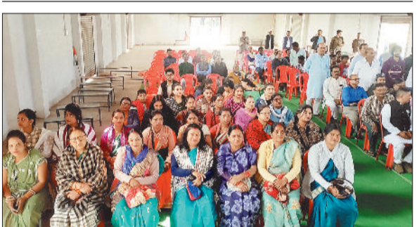
बैठक में उपस्थित लोग।